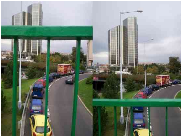
Trochu jiná perspektiva běžného chodce a člověka na vozíku

za mě, takže jsem si strašně přála mít nějakou možnost jí pomoci. Člověk si ale asi vážně zvykne skoro na všechno, protože postupem doby, kterou jsem strávila pasivním sezením na vozíku, mi to vadilo o něco méně, i když bych si na to určitě nikdy nedokázala zvyknout úplně. Asi šlo hlavně o to překonat počáteční šok, že se najednou nemůžu přemístit, kam já chci, dojít si pro to, pro co chci.